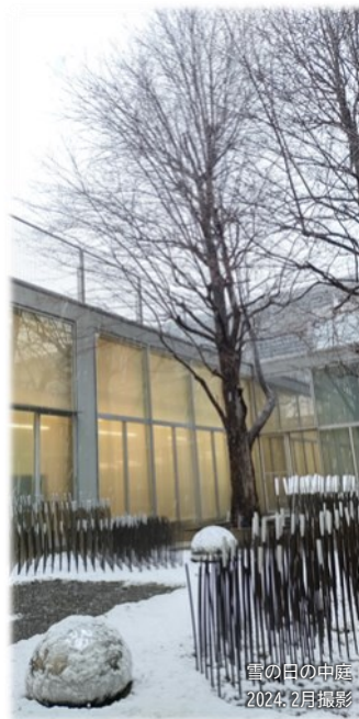
雪の日の中庭 2024.2月撮影