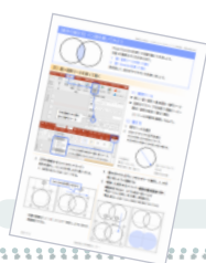
ワークショップ配布テキスト

PowerPointの図形ツール等を使い、参加者も一緒に数種類の方法でベン図を描くミニ講座。オブジェクトの基本的な扱い方やtipsなど、ちょっとしたスキルの1upを目指したワークショップ。